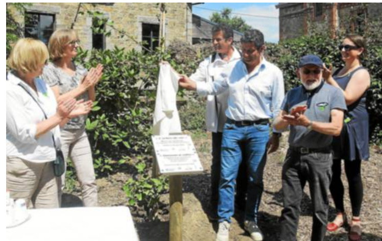
Le ginkgo biloba ou « arbre de vie » a été planté par les services de la ville dans la partie haute du jardin public de Guingamp, près de la grille d'entrée nord.