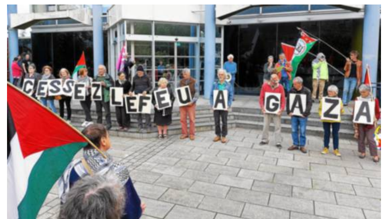
« L'AFPS Trégor réaffirme que son combat ne s'accommode pas et ne s'accommodera jamais de quelque forme de racisme, d'ostracisme ou de discrimination que ce soit », explique l'association dans un communiqué publié le 18 juin.

« Pour que la France joue tout son rôle dans l'affirmation et l'établissement de la justice et du droit en Israël-Palestine, seuls garants du retour de la paix », l'antenne trégoroise de l'association France Palestine solidarité appelle à manifester, samedi 22 juin, place des Droits de l'homme, à Lannion. Pour l'AFPS, « l'annonce d'une pause quotidienne dans les actions militaires d'Israël ne doit tromper personne : il n'est toujours pas question pour Netanyahu de mettre un terme au martyre de la population gazaouie ».